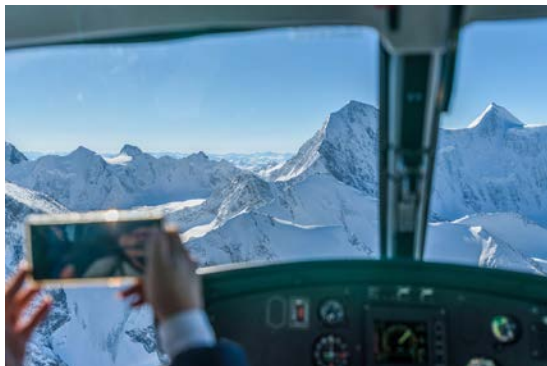
На вертолете к Белухе

Есть места, куда не доедет обычный автомобиль и не доведет проторенная тропа. Алтай хранит заповедные уголки, добраться до которых – уже приключение: на вертолете сквозь облака, на мощном джипе по каменистым серпантинам или пешком, шаг за шагом, с рюкзаком за плечами. Именно там, вдали от шумных маршрутов, раскрывается подлинная мощь и красота алтайской природы – нетронутая и первозданная.