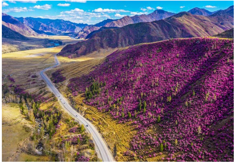
Цветение маральника у села Купчегень

Серпантинный перевал Чике-Таман (1295 м) открывает захватывающие виды на горные хребты. В старину перевал был одним из самых труднопроходимых мест на Чуйском тракте.