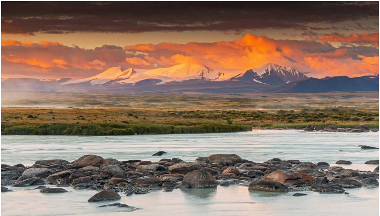
Плато Укок и Табын-Богдо-Ола