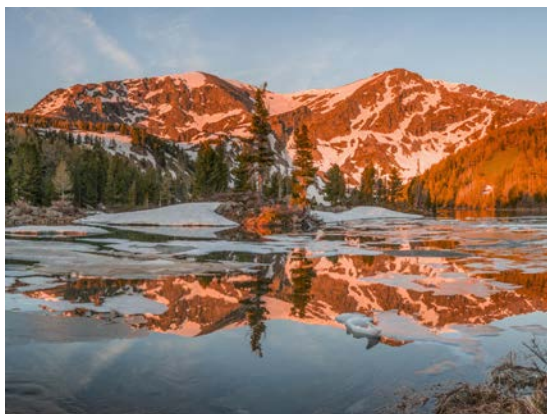
Озера Красной Горы

Усть-Коксинский район, или Алтайское Беловодье. По легендам, земля светлая и чистая, где реки прозрачны, как слезы, а горы хранят древние тайны. Уймонская долина находится среди вершин Катунского и Теректинского хребтов, здесь течет священная Катунь. Это место для настоящих путешественников и любителей горных походов: тропы ведут к уединенным горным озерам и величественным заснеженным пикам.