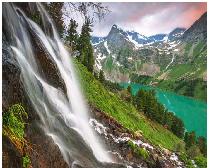
Водопад над Верхним Мультинским озером