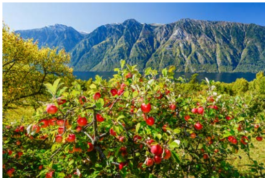
Яблоневые сады на Беле

В давние времена охотник нашел огромный золотой самородок, но в годы голода не смог обменять его на еду. В отчаянии он поднялся на скалу над озером, бросил золото в воду и воскликнул: «Зачем мне богатство, если я не могу купить за него и горсть ячменя, накормить голодную семью!» Духи приняли жертву – пошли дожди, люди выжили. С тех пор озеро называют Алтын-Кёль , напоминая, что истинное богатство – не в золоте, а в единстве с природой.