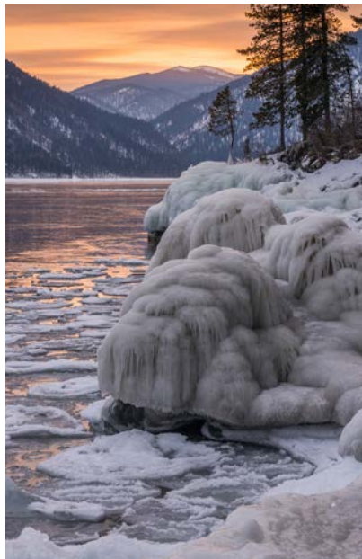
Телецкое озеро зимой