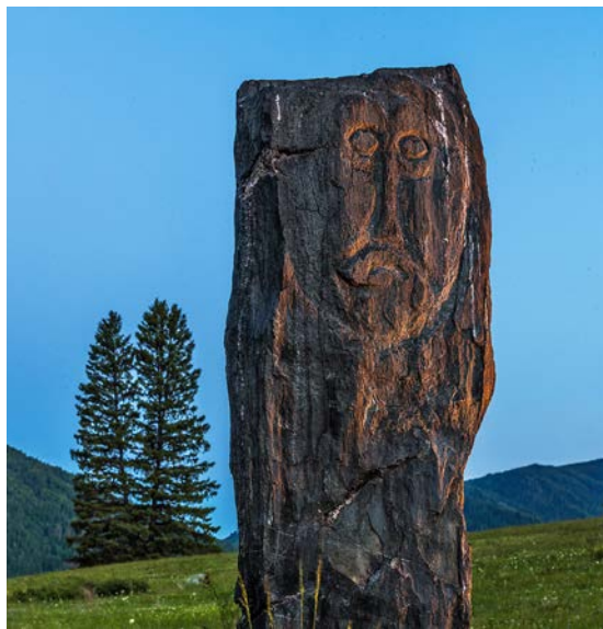
Каменный воин Тургунды

Озеро Куйгук – живописный высокогорный водоем (2030 м над уровнем моря). Из-за затененности горными хребтами лед на поверхности может держаться до конца июня.