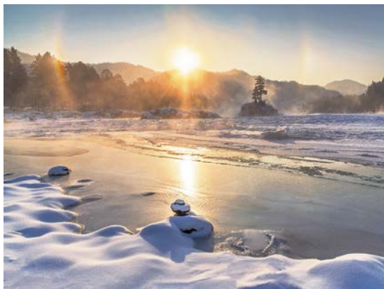
Гало над Катунью

Река Катунь (в переводе с алтайского «Кадын» – «госпожа, хозяйка») протянулась на 688 км от южного склона горы Белуха до слияния с рекой Бией, где рождается одна из крупнейших рек мира Обь. Пейзажи Катунь разнообразны. В мае она украшена цветущими кустами маральника, рододендрона Ледебура. В сентябре становится бирюзовой в окружении золотых деревьев. Здесь можно сплавиться по бурным порогам, остановиться в уютном отеле и полюбоваться мощью и красотой алтайской реки.