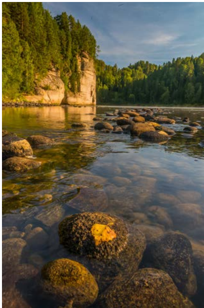
Приток Бии – река Лебедь