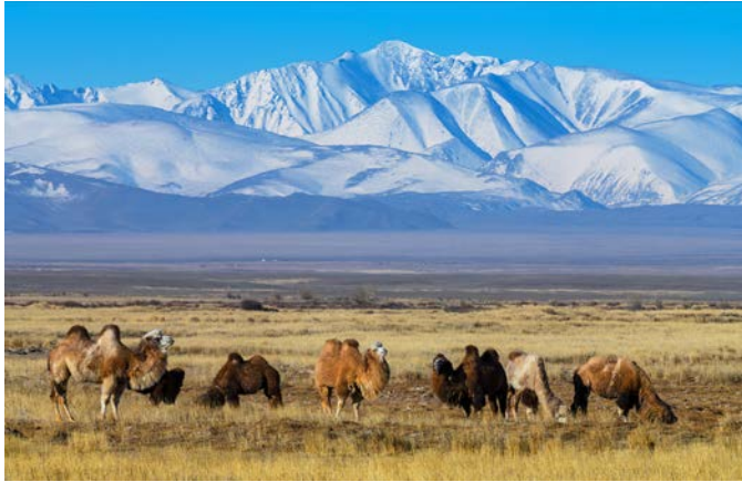
Верблюды в Чуйской степи