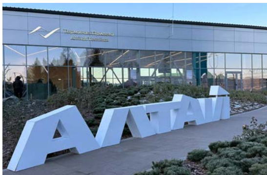
Международный аэропорт «Горно-Алтайск»

На въезде гостей встречает новая стела с традиционной алтайской коновязью . Она символизирует гостеприимство и уважение к обычаям. На нижнем «поясе» стелы указаны исторические названия Горно-Алтайска – Улала, Ойрот-Тура и современное наименование.