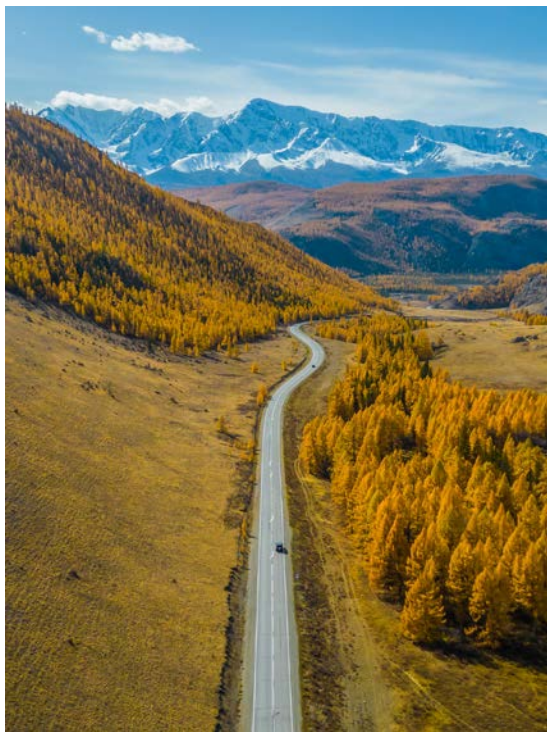
Чуйский тракт и Северо-Чуйский хребет

Чуйский тракт, включенный National Geographic Russia в число десяти самых красивых в мире, с давних времен был оживленным торговым путем. По нему шли караваны, а купцы и кочевники слагали легенды о духах гор и священных местах. Особую роль в истории дороги сыграл известный писатель Вячеслав Яковлевич Шишков. Будучи инженером-изыскателем, он в начале XX века руководил экспедициями по проектированию Чуйского тракта, а позже запечатлел его образы в повести «Чуйские были».