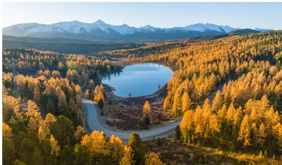
Озеро Киделю и Улаганский тракт