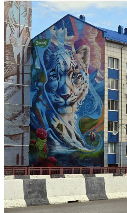
Мурал «Снежный барс»

Национальный драматический театр имени П. В. Кучияка вблизи площади Ленина расположен в здании, напоминающем традиционное алтайское жилище аил. Театр носит имя алтайского драматурга, а репертуар включает спектакли как на русском, так и на алтайском языках.