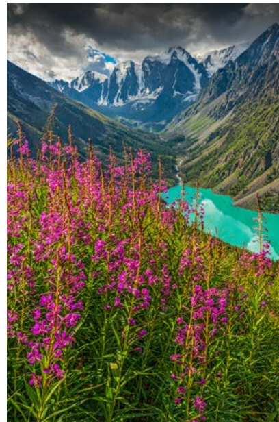
Нижнее Шавлинское озеро

Кучерлинское озеро расположено в пределах природного парка «Белуха». Его бирюзовая вода питается талыми водами нескольких ледников. Глубина достигает 54 м. Кристально чистая вода с бирюзовым оттенком обусловлена взвесью ледниковой муки.