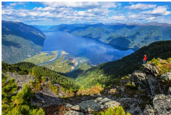
Телецкое озеро и устье Чулышмана

Телецкое озеро – объект Всемирного наследия ЮНЕСКО: одно из глубочайших озер России (325 м) с кристально чистой водой. Окруженное природой Алтайского заповедника, озеро поражает первозданной красотой: с его скалистых берегов ниспадают живописные водопады, а обрывы создают неповторимые пейзажи.