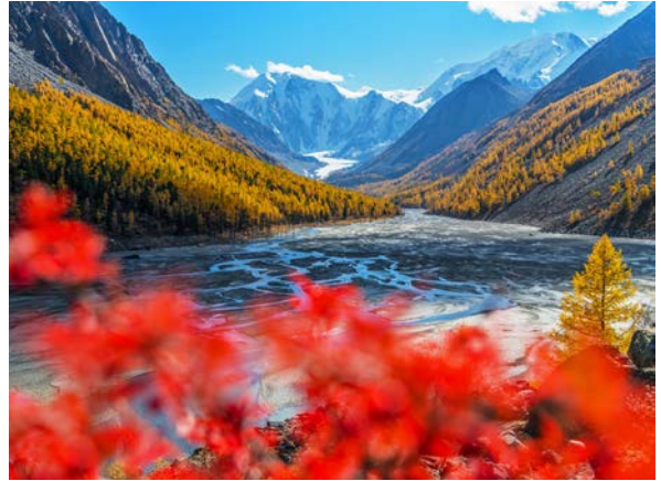
Гора Карагем, Северо-Чуйский хребет