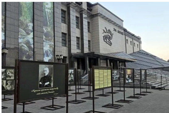
Национальный музей им. А. В. Анохина

Центральный сквер культуры и отдыха является продолжением площади Ленина. Он заложен в 1935–1936 годах ученым-агрономом М. А. Лисавенко как «ботанический сад в миниатюре». Здесь соседствуют типичные для Алтая растения и экземпляры, привезенные с Дальнего Востока. В центре сквера – новый цветодинамический фонтан, который изображает годичный цикл по алтайскому календарю: 12 бронзовых медальонов символизируют Республику Алтай и ее муниципальные образования.